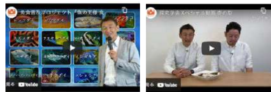
YouTubeに動画をアップ ※1本あたり15~20分程度