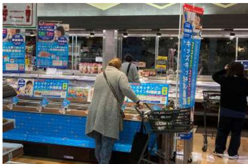
POPやのぼりなどを活用した店頭でのイベント告知