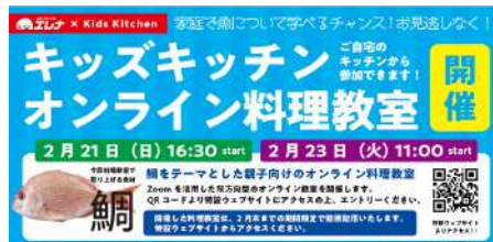
地方新聞やタウン情報サイトでイベント告知の広告